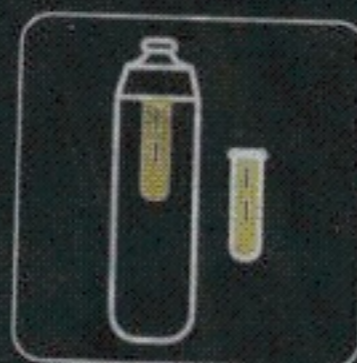
butelkę filtrującą z nowym filtrem