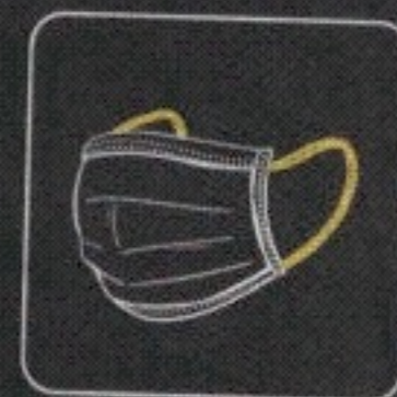
maski oddechowe /ochronne