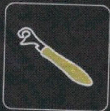
otwieracz do puszek