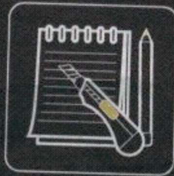
nóż, ołówek i notes