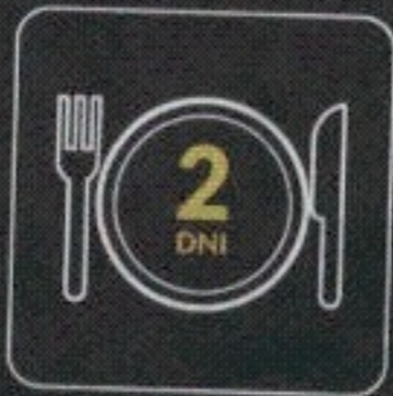
posiłki na 2 dni