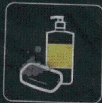
mydło, żel do dezynfekcji