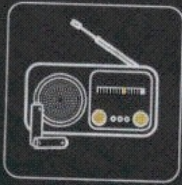
radio na baterie + baterie