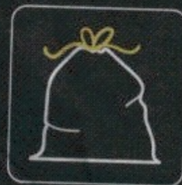
worki na śmieci