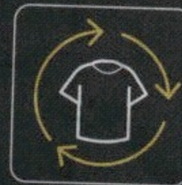
ubranie na zmianę