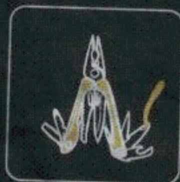
kombinerki, łom, narzędzie wielofunkcyjne