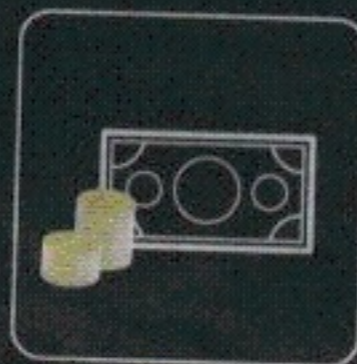
gotówkę w niewielkich nominałach