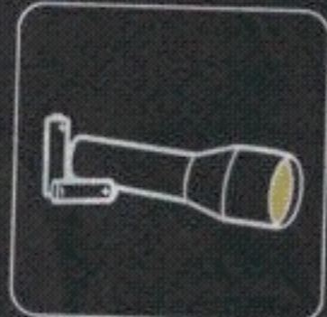
latarka + baterie